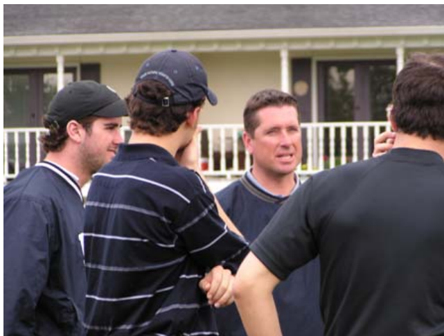
Échange préséance entraîneur – athlètes

L'élan de chaque athlète est aussi régulièrement capté sur bande vidéo lors de sessions d'entraînement tant à l'extérieur qu'à l'intérieur. Le visionnement de ces cassettes permet de constater la progression des athlètes et d'apporter les correctifs techniques appropriés. Le temps venu, les bandes vidéo s'avèrent aussi un outil de présentation et de promotion très efficace auprès des entraîneurs d'équipes de golf des universités canadiennes et américaines.